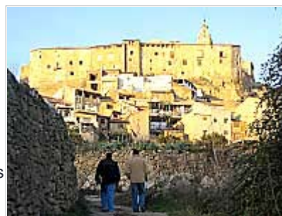
Vista general tomada desde el río del palacio vizcondal de Chelva.